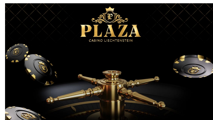
So sieht die Webseite des Plaza-Casinos aus.