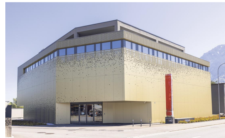
Das Casino Maximus wollte schon im April eröffnen.