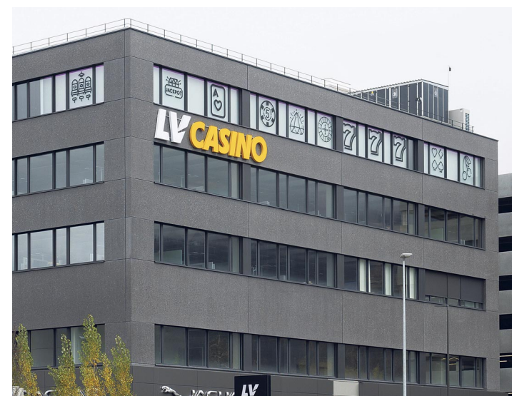
Das Casino in Eschen wartet auf seine Bewilligung.